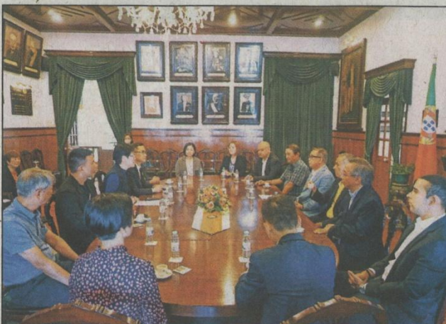
飛安達等與街總代表交流應援基金支援情況

她稱，今年澳門社會受到新冠疫情影響，求助個案明顯增加，首三個月平均每月申請個案近六宗，合共二十宗，應急援助基金面臨資金緊絀，在這個艱難時期，澳門仁慈堂仍克服困難繼續為基金注資，可謂雪中送炭，心懷大愛，用實際行動對弱勢社群作出有力支援。相信在澳門仁慈堂和該會的共同努力、社會各界熱心人士的支持下，應急援助基金定會繼續運行順暢，幫助到更多有需要的弱勢家庭。